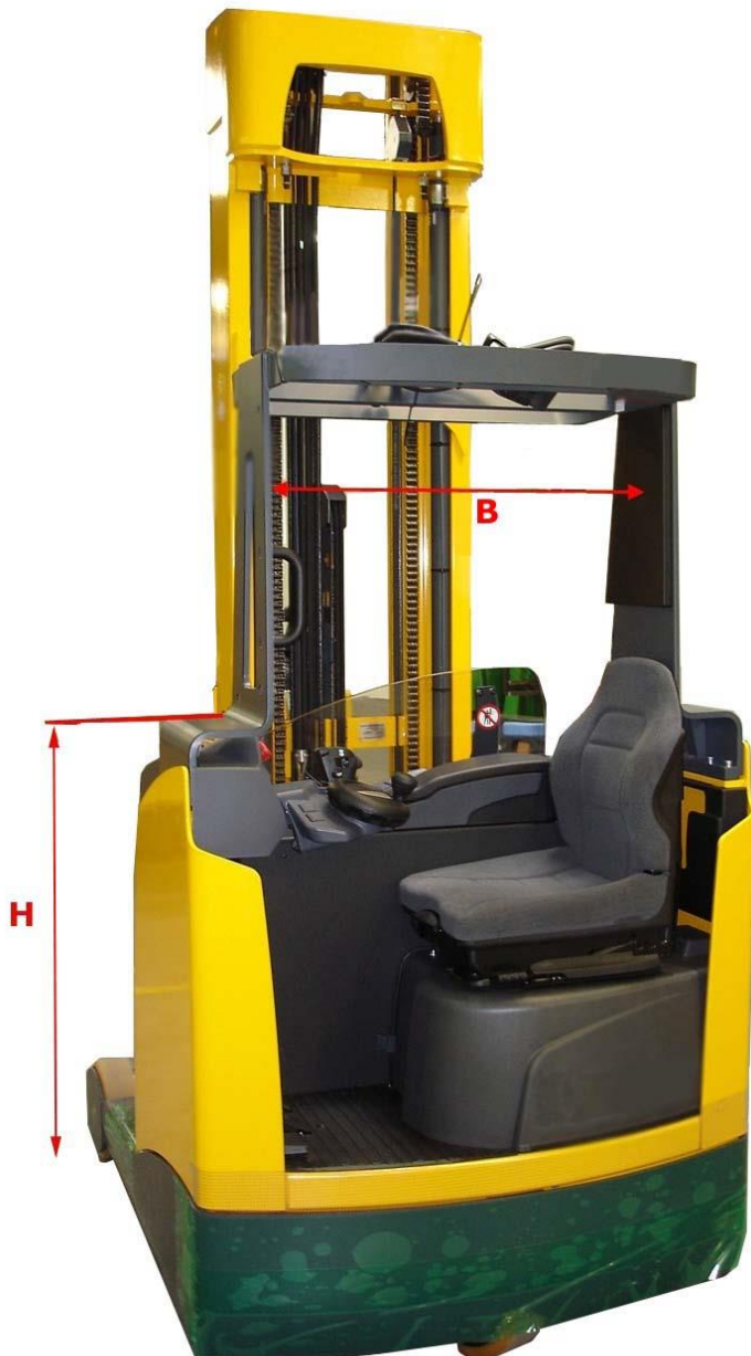
Fahrerschutzdach für „EINFAHRREGAL“ Overhead guard for „DRIVE-IN“ racks Toit de protection pour rayonnage „ACCUMULATION“